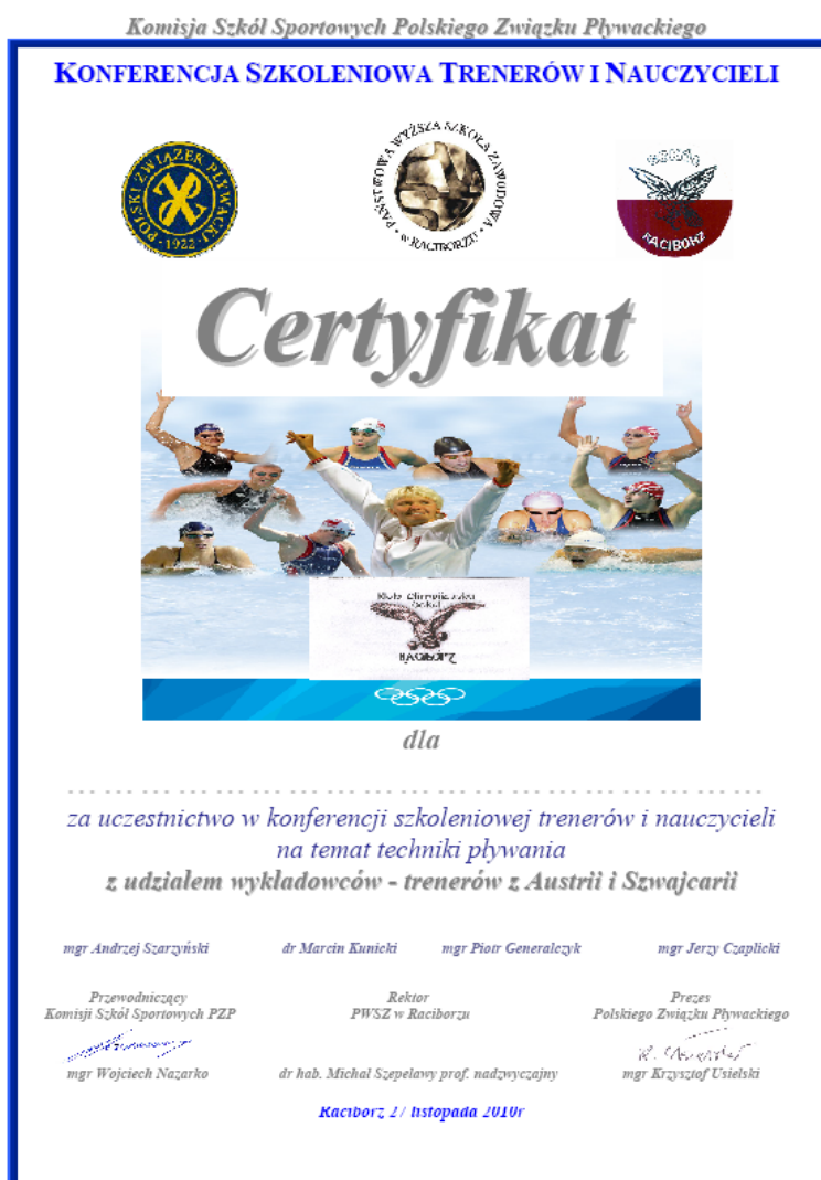
Państwowa Wyższa Szkoła Zawodowa w Raciborzu

Na zakończenie uczestnicy otrzymali okolicznościowe certyfikaty.